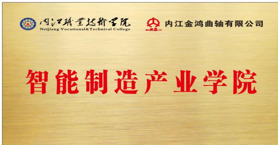
与金鸿曲轴有限公司共建产业学院